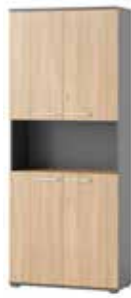
OMEGA 05 szafa 4-drzwiowa szer. x wys. x gł. 90 x 219 x 38 cm

4-door wardrobe W x H x D 90 x 219 x 38 cm