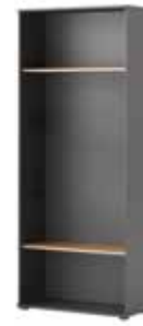
OMEGA 01 regał/korpus szer. x wys. x gł. 90 x 219 x 38 cm