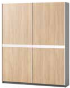
OMEGA 12 szafa 2-drzwiowa szer. x wys. x gł. 180 x 219 x 41 cm

2-door wardrobe W x H x D 180 x 219 x 41 cm