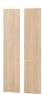
OMEGA 04 fronty do regału OMEGA 01 - 2 szt. szer. x wys. x gł. 90 x 213 x 2 cm