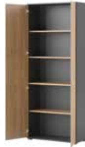
przykładowe zestawienie OMEGA 01, 02 i 04