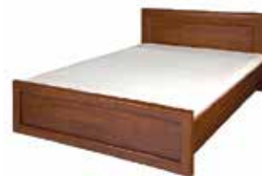
DOVER 76* łóże 160 (bez materaca i rusztu) szer. x wys. x gł. 165 x 89/44 x 207 cm bed 160 (without mattress and frame) W x H x D 165 x 89/44 x 207 cm