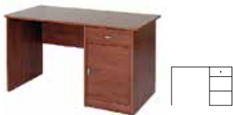
DOVER 40 biurko 1-drzwiowe z 1 szufladą szer. x wys. x gł. 140 x 77 x 70 cm 1 door 1 drawer desk W x H x D 140 x 77 x 70 cm