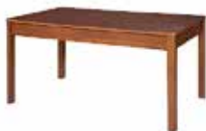
DOVER 08* stół rozsuwany szer. x wys. x gł. 160-200 x 76 x 90 cm extendable table W x H x D 160-200 x 76 x 90 cm