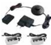
3-L-BC-2-0000-01 zestaw oświetleniowy półki szklanej (2 x punkt świetlny LED, 1 x transformator) Do modeli Dover: 16, 18 Lighting system of a glass shelf (2 x LED, 1 x transformer) for models Dover: 16, 18