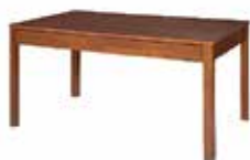
DOVER 43 stół rozsuwany szer. x wys. x gł. 140-180 x 76 x 90 cm extendable table W x H x D 140-180 x 76 x 90 cm