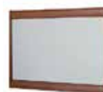
DOVER 04* lustro wiszące szer. x wys. x gł. 100 x 74 x 4 cm hanging wall mirror W x H x D 100 x 74 x 4 cm