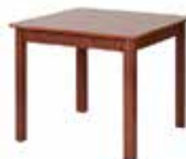
DOVER 42 stół rozsuwany szer. x wys. x gł. 90-120 x 76 x 90 cm extendable table W x H x D 90-120 x 76 x 90 cm