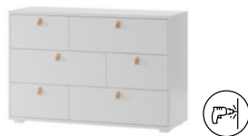
DOMINI 09 komoda z 6 szufladami szer. x wys. x gł. 120 x 80 x 42 cm dresser with 6 drawers W x H x D 120 x 80 x 42 cm