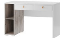
DOMINI 08 biurko z 2 szufladami szer. x wys. x gł. 120 x 77 x 60 cm desk with 2 drawers W x H x D 120 x 77 x 60 cm