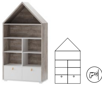
DOMINI 01 regał wysoki z 2 szufladami szer. x wys. x gł. 98 x 185 x 42 cm tall shelf unit with 2 drawers W x H x D 98 x 185 x 42 cm