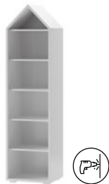
DOMINI 13 regał wąski szer. x wys. x gł. 49 x 185 x 42 cm narrow shelf unit W x H x D 49 x 185 x 42 cm