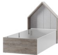
DOMINI 11 łóżko pod materac 90 x 200 z oświetleniem i tapicerowanym wezwłowie w standardzie szer. x wys. x gł. 101 x 131 x 209 cm bed for the mattress 90x200 with illumination as standard W x H x D 101 x 131 x 209 cm