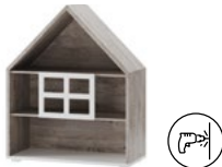
DOMINI 06 regał niski szer. x wys. x gł. 98 x 120 x 42 cm low shelf unit W x H x D 98 x 120 x 42 cm