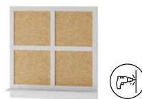
DOMINI 14 tablica korkowa szer. x wys. x gł. 80 x 80 x 12 cm cork board W x H x D 80 x 80 x 12 cm