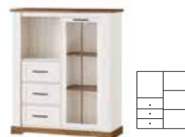
COUNTRY 15 | witryna niska 1-drzwiowa z 3 szufladami | 1 door display unit with 3 drawers opcjonalne oświetlenie | optional lighting szer. x wys. x gł. | W x H x D 116 x 137 x 45 cm