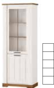
COUNTRY 10 L/P | L/R witryna 2-drzwiowa | 2 door display unit opcjonalne oświetlenie | optional lighting szer. x wys. x gł. | W x H x D 79 x 204 x 45 cm