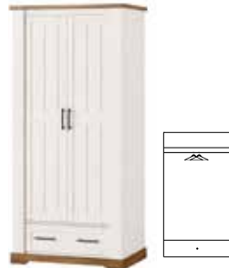
COUNTRY 70 | szafa 2-drzwiowa z 1 szufladą | 2 door wardrobe with 1 drawer szer. x wys. x gł. | W x H x D 94 x 204 x 63 cm