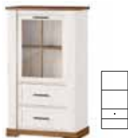
COUNTRY 14 L/P | L/R witryna niska 1-drzwiowa z 2 szufladami (barek) | 1 door display unit with 2 drawer opcjonalne oświetlenie | optional lighting szer. x wys. x gł. | W x H x D 79 x 137 x 45 cm