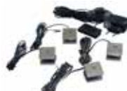
3-L-BZ-4-0030-01 | zestaw oświetleniowy półki drewnianej (4 x klips LED, 1 x transformator) | lighting system for wooden shelf (4 x LED clip, 1 x transformer) Do modeli | for models Country: 12