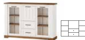
COUNTRY 48 | bufet 2-drzwiowy z 2 szufladami i barkiem | 2 door sideboard with 2 drawers opcjonalne oświetlenie | optional lighting szer. x wys. x gł. | W x H x D 163 x 113 x 45 cm