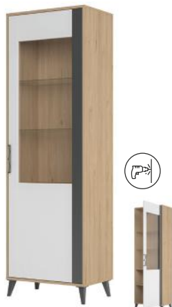
MOET 11 witryna 1-drzwiowa (oświetlenie opcjonalne) szer. x wys. x gł. 65 x 204 x 42 cm

1-door display unit (optional lighting) W x H x D 65 x 204 x 42 cm