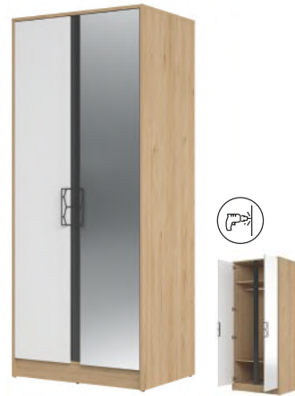
MOET 70 szafa 2-drzwiowa z lustrem szer. x wys. x gł. 84 x 200 x 60 cm

2-door display unit (optional lighting) W x H x D 90 x 204 x 42 cm