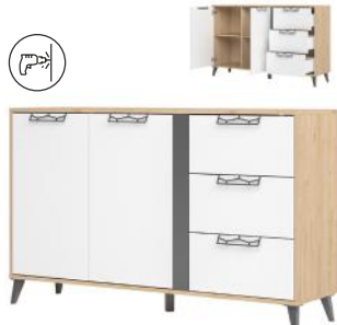
MOET 45 komoda 2-drzwiowa z 3 szufladami szer. x wys. x gł. 150 x 92 x 42 cm

2-door sideboard (optional lighting) W x H x D 90 x 135 x 42 cm