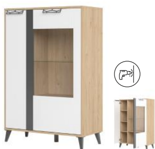
MOET 15 komoda 2-drzwiowa (oświetlenie opcjonalne) szer. x wys. x gł. 90 x 135 x 42 cm

2-door wardrobe with mirror W x H x D 84 x 200 x 60 cm