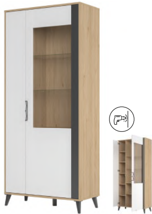
MOET 12 witryna 2-drzwiowa (oświetlenie opcjonalne) szer. x wys. x gł. 90 x 204 x 42 cm

1-door display unit (optional lighting) W x H x D 65 x 204 x 42 cm