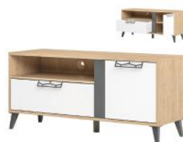
MOET 24 szafka RTV 1-drzwiowa z 1 szufladą szer. x wys. x gł. 120 x 55 x 42 cm

2-door sideboard with 3 drawers W x H x D 150 x 92 x 42 cm