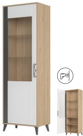
MOET 10 witryna 1-drzwiowa (oświetlenie opcjonalne) szer. x wys. x gł. 65 x 204 x 42 cm

1-door display unit (optional lighting) W x H x D 65 x 204 x 42 cm