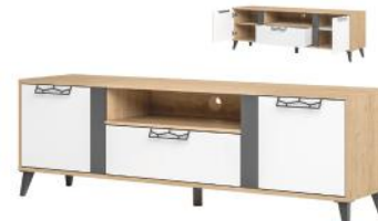
MOET 25 szafka RTV 2-drzwiowa z 1 szufladą szer. x wys. x gł. 170 x 55 x 42 cm

1 door TV unit with 1 drawer W x H x D 120 x 55 x 42 cm