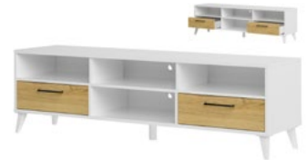
BARRIS 25 szafka RTV z 2 szufladami szer. x wys. x gł. 160 x 47 x 42 cm

TV unit with 2 drawers W x H x D 120 x 47 x 42 cm