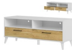
BARRIS 24 szafka RTV z 2 szufladami szer. x wys. x gł. 120 x 47 x 42 cm

2-door sideboard with 3 drawers W x H x D 140 x 85 x 42 cm